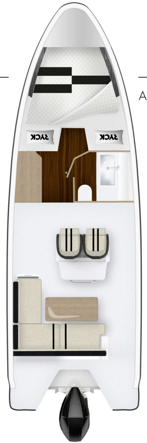
OPTION Kabine & voll ausgestattetes Bad mit Toilette